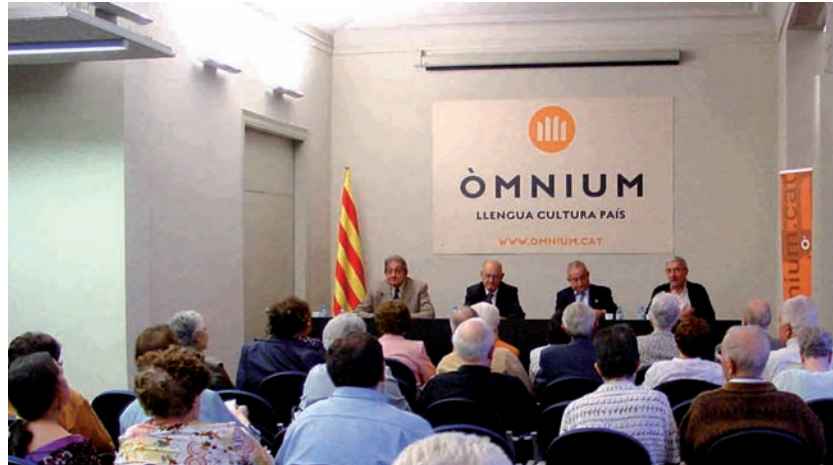
Taula de presidència i part dels assistents en la presentació a Barcelona

L'origen d'aquesta Miscel·lània va ser la missa que celebra cada Onze de Setembre l'esmentada Lliga Espi-